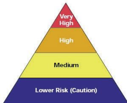
Pirámide de riesgos laborales para COVID-19

riesgo trabajador de la exposición ocupacional al SARS-CoV-2, el virus que causa COVID-19, durante un brote puede variar de muy alta a alta, media o menor riesgo (precaución). El nivel de riesgo depende en parte del tipo de industria, necesidad de contacto dentro de los 6 pies de las personas que se sabe que, o se sospeche que están infectados con el SARS-CoV-2, o la necesidad de repetir o prolongado contacto con personas que se sabe que, o se sospeche que están infectados con SARS-CoV-2. Para ayudar a los empleadores a determinar las precauciones adecuadas, OSHA ha dividido las tareas de trabajo en cuatro niveles de exposición al riesgo: muy alto, alto, medio y menor riesgo. La pirámide de riesgos laborales muestra los cuatro niveles de riesgo de exposición en la forma de una pirámide para representar la distribución probable de riesgo. La mayoría de los trabajadores estadounidenses probablemente caerán en el menor riesgo de exposición (precaución) o los niveles de riesgo de exposición medianas.